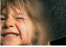
| Ornament 504 weiß |