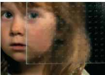
| Mastercarre weiß |