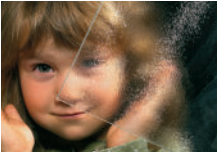
| Chinchilla weiß |